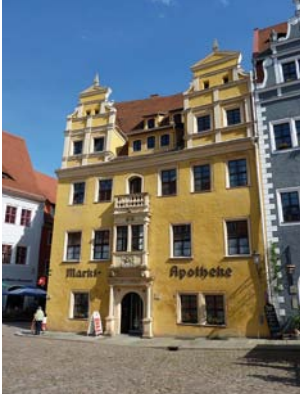
Marktapotheke in Meißen

Zu den sehenswerten Altstadthäusern , die um den Markt herum gebaut und durch kleine, gewundene Gassen miteinander verbunden sind, gehören vor allem die Marktapotheke , ein Renaissancebau von 1560, das Brauhaus (An der Frauenkirche 3) und das Bennohaus am Markt.