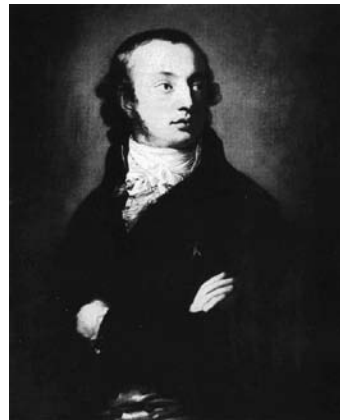
Dietrich von Miltitz

Im Jahre 1997 wurde das Schloss Siebeneichen dem Bereich des Sächsischen Staatsministeriums für Kultus und Sport zugeordnet. Nach umfangreichen Restaurationen wurde in den Räumlichkeiten zunächst die Akademie für Lehrerfortbildung untergebracht. Seit 2007 wird die Liegenschaft, die eine Außenstelle des Sächsischen Bildungsinstituts ist, als Fortbildungs- und Tagungszentrum genutzt. Dabei ist das Sächsische Bildungsinstitut bestrebt, die tief in der Geschichte des Schlosses als auch des Landkreises Meißen verwurzelten Traditionen zu pflegen, kulturell auszugestalten und die Räumlichkeiten – soweit möglich – der Öffentlichkeit zugänglich zu machen.