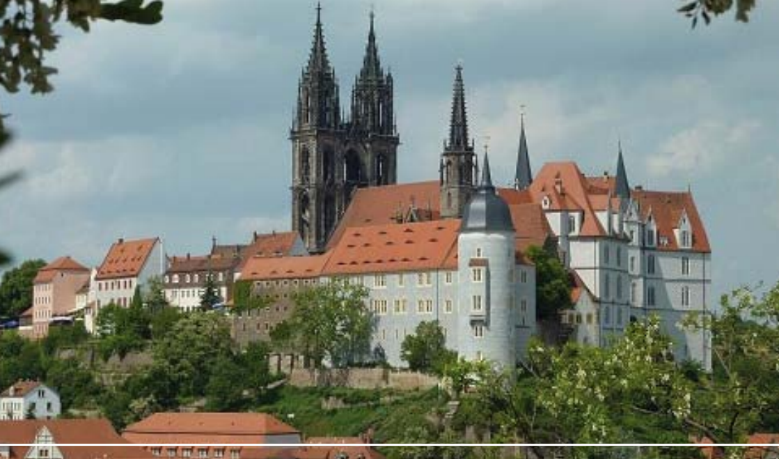
Albrechtsburg mit Dom

risch auf ein Anwachsen der Ortschaft schließen lässt. Demzufolge ist um das Jahr 1000 eine Marktsiedlung und um 1002 ein Jahrmarkt urkundlich überliefert. Trotz einiger, schon früher urkundlich erwähnter Markgrafen erfolgte die offizielle Stadtgründung Meißens erst unter Markgraf Dietrich um 1205.