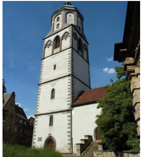
Frauenkirche Meißen

Die Frauenkirche (am Markt), welche 1205 erstmals urkundlich erwähnt wurde, ist nach Bränden von 1447 und 1454 als dreischiffige spätgotische Hallenkirche wieder aufgebaut worden.