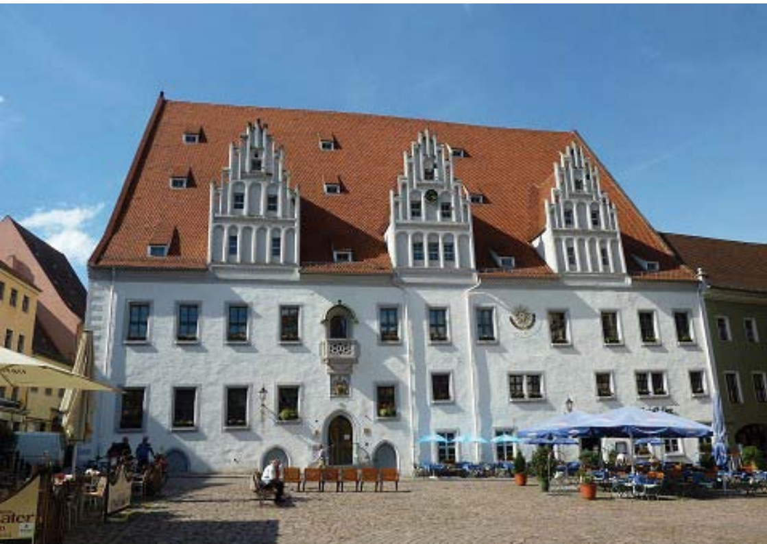
Meißner Rathaus

Der Bau des Rathauses (am Markt) wurde 1472 begonnen und 1478 fertig gestellt. Im Inneren des Hauses weisen einige Räume noch Holzbalkendecken auf, die aus dessen Entstehungszeit stammen.