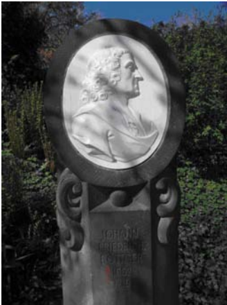
Denkmal von Johann Friedrich Böttger auf den Brühlschen Terrassen in Dresden

Heute erinnert eine Büste Johann Friedrich Böttgers vor dem Eingang des Museums an den Entdecker des „Weißen Goldes“, der anfangs seine Porzellanerzeugnisse mit „AR“ (Augustus Rex) kennzeichnen musste. Ab 1723 wurden diese mit dem Emblem der blauen gekreuzten Schwerter signiert und erlangten weltweite Bekanntheit.