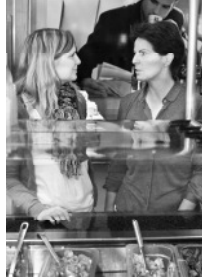
At the canteen