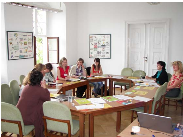
SomA 2009: Arbeit im Workshop Im Deutschunterricht in die Fremde reisen

Die Sommerakademie ist offen für alle Führungskräfte, Lehrer wie auch Mitarbeiter aus SMK, SBA und SBI sowie nationale und internationale Gäste und findet jedes Jahr in der ersten Woche der Sommerferien statt.