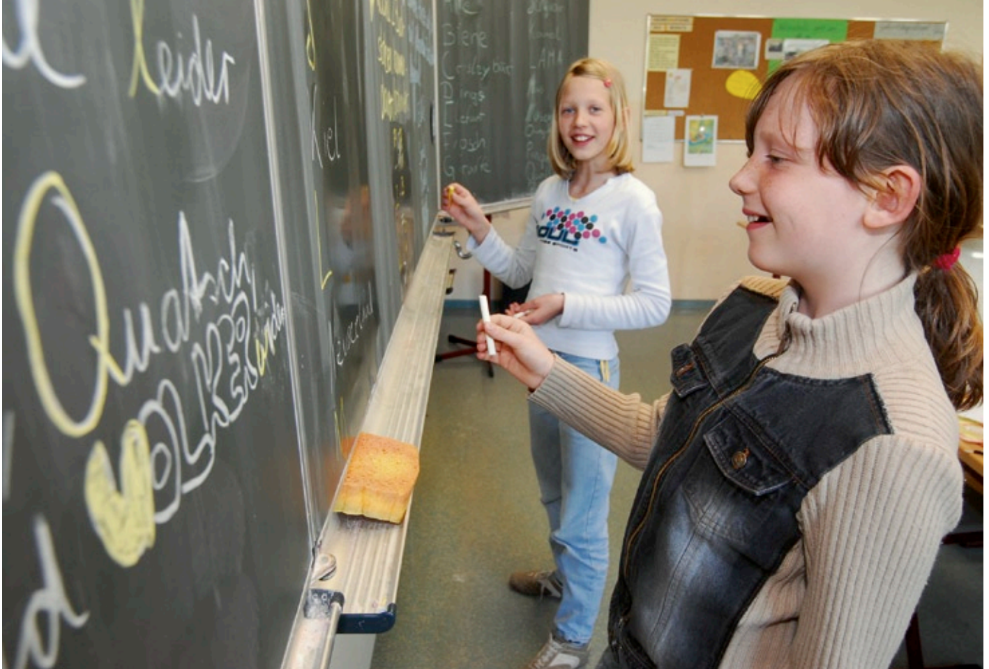
»Schreibschule«, ein Angebot am Nachmittag für Schüler der 5. Klasse