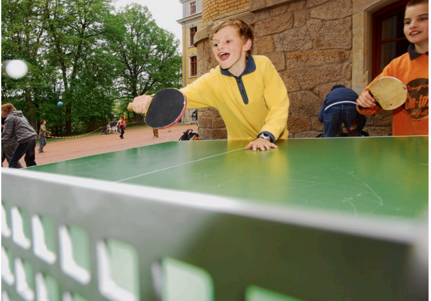
Sportangebote können bei der Rhythmisierung eine wichtige Rolle spielen.